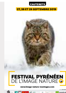
Chat forestier, Bugey, France