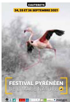
Flamant rose, Camargue, France