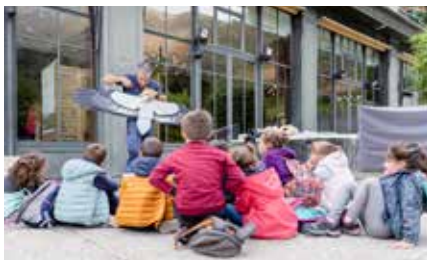
Cauterets