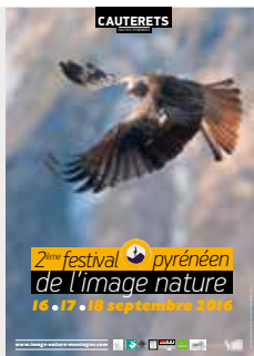
Milan royal, Hautes-Pyrénées, France