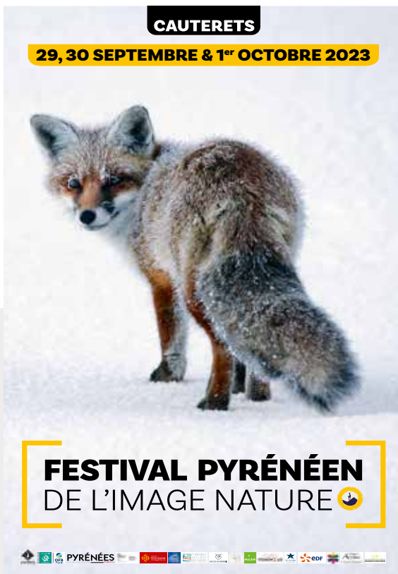
Renard roux, Bugey, France