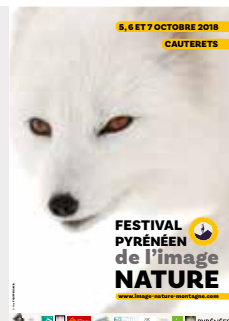
Renard polaire, Islande