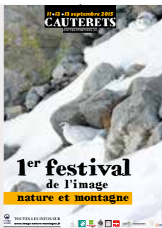
Lagopède alpin, Hautes-Pyrénées, France