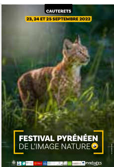
Lynx, Jura, Suisse