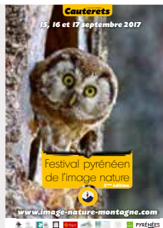
Chouette de Tengmalm, Hautes-Pyrénées, France